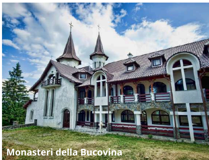
Monasteri della Bucovina

Prima colazione in hotel. Partenza per Miercurea Ciuc. Visita del monastero Agapia del XVII sec., famoso sia per il suo museo, che conserva delle bellissime icone e ricami, sia per i suoi laboratori dove potrete vedere all'interno il lavoro delle suore. Ritorno in Transilvania attraversando nuovamente i Carpazi, per le Gole di Bicaz, il più famoso canyon del Paese, lungo 10 km, formato da rocce calcaree mesozoiche alte 300-400 m, si passa nei pressi del Lago Rosso, lago originato da uno sbarramento naturale provocato dallo scoscendimento lungo il pendio della montagna, nel 1837; dall'acqua emergono i tronchi pietrificati degli abeti. Pranzo in un ristorante lungo il percorso. Nel tardo pomeriggio si raggiungerà la città di Miercurea Ciuc. Cena e pernottamento presso hotel FENYO 3*.